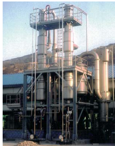
Falling Film Evaporator A2E2S-FF