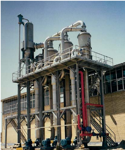
Forced Circulation Evaporator A3E3S-FC-HB-F