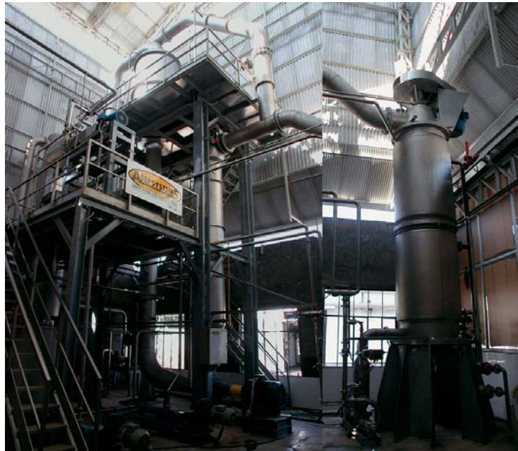
Forced Circulation and Turbulent Thin Film Evaporator A2E2S-MIX