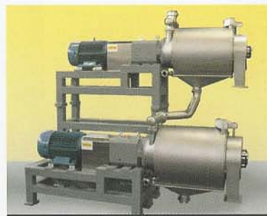
HTE 4/400 con RSA 200/F e AST 900

e della relazione con l'interlocutore sia esso cliente oppure no. La disarmante semplicità che caratterizza i macchinari dell'Asepsystems è il frutto di una costante ricerca che ha per obiettivo l'affidabilità e la durabilità degli impianti negli anni, perché l'indisponibilità della macchina, sia essa per guasto ma anche per semplice manutenzione, costituisce per la clientela una fonte di problemi prima ancora che di danno economico. Da quanto premesso ecco che il necessario esame del catalogo dei prodotti non può che risultare come lo scorrere di una lista incompleta di equipaggiamenti che non esauriscono la capacità di fornitura, ma che possono aiutare per seguire l'evoluzione dell'azienda. Ecco dunque i macchinari asettici, quali sterilizzatori e riempitrici per ogni capacità di confezionamento, la cui indiscussa qualità è evidenziata dal fatto che Asepsystems è spesso anche sub-fornitrice per altre importanti realtà produttive di impiantistica.